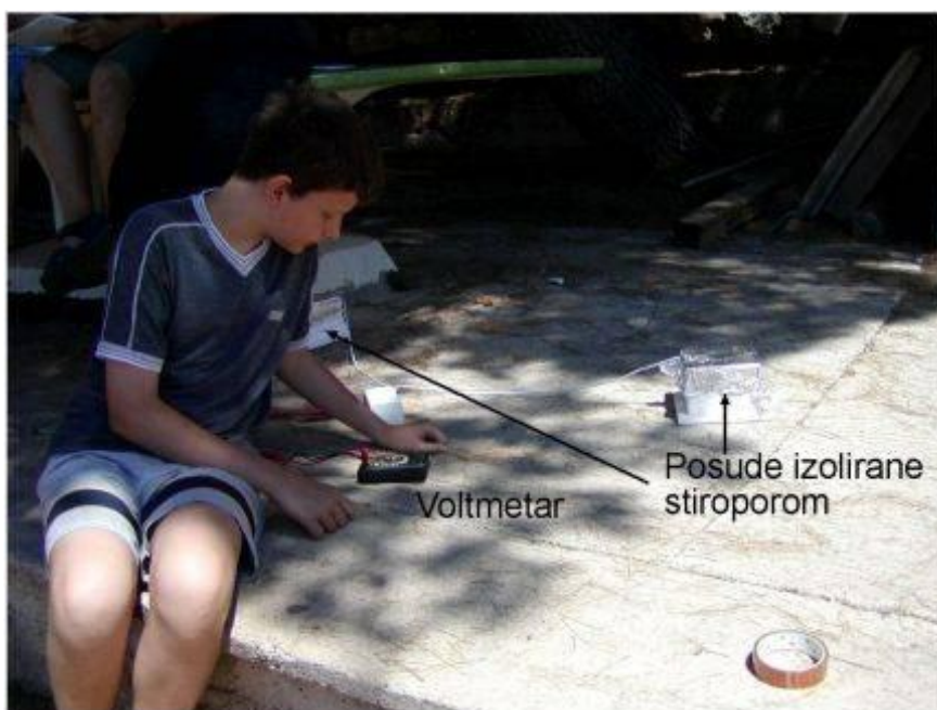
Slika 1. Mjerenje solarne konstante: vidimo dvije kutije od stiropora u kojima se nalaze čaše napunjene vodom.

Pripremili smo dvije jednake posude izolirane sa stiroporom (npr. plastične čaše od jogurta) i od aluminijske folije pripremili poklopce za posude. Jednu foliju obojili smo mat crnom bojom, ili začađili pomoću svijeće. Od stiropora pripremili smo oblogu za izoliranje posuda od okoline i to takvu da su Sunčevom svjetlu izloženi samo aluminijski poklopci. Zatim smo napunili posude vodom. Za mjerenje temperature u ovoj vježbi napravili smo električni sklop na čijem su se jednom kraju nalazila dva termočlanaka, a na drugom voltmetar na kojem smo odmah mogli očitavati razliku temperature na termočlancima. Ovakvo mjerenje temperature pokazalo se boljim nego sa običnim živinim termometrima, zbog veće preciznosti i jednostavnosti mjerenja (slika 1.).